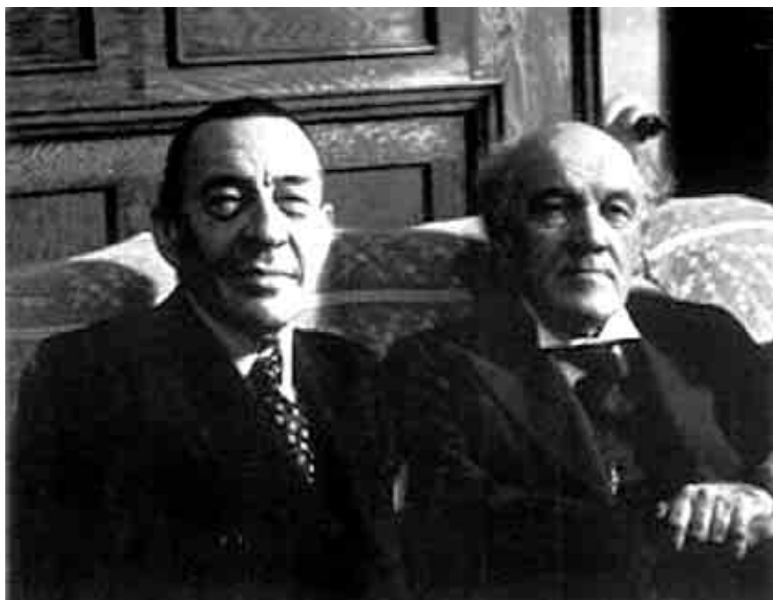
Rachmaninov y Medtner

(1855-1899), cuyo maravilloso Cuarteto con piano pudimos escuchar hace dos temporadas de la mano de Renaud y Gautier Capuçon, Roussel (1869-1937) y Dukas (1865-1935). Este último es, además, uno de esos músicos conocidos mayoritariamente por una única obra, en este caso por El aprendiz de brujo que fue immortalizado por Walt Disney en su película Fantasia .