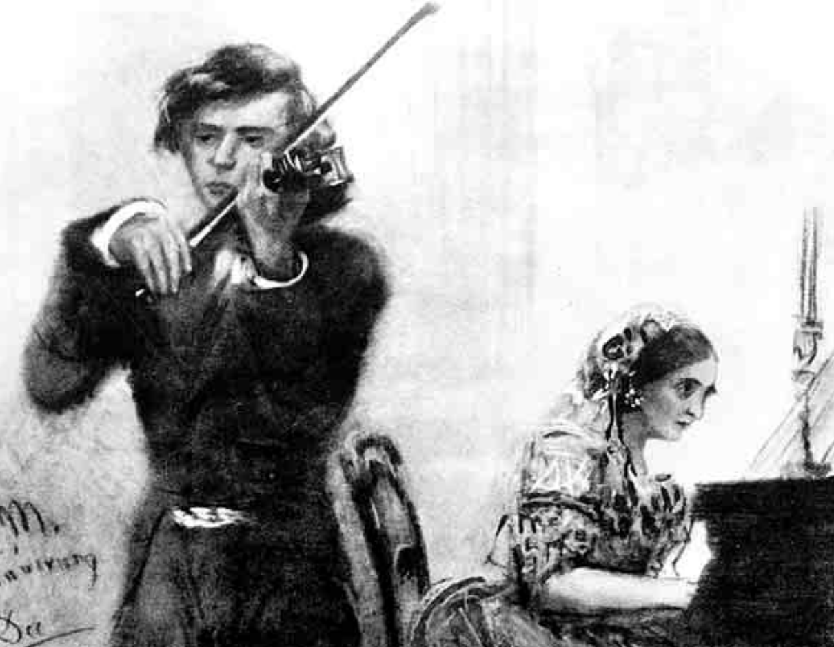
Adolph Friedrich Erdmann von Menzel (1815-1905):

Clara Schumann y Joseph Joachim en concierto