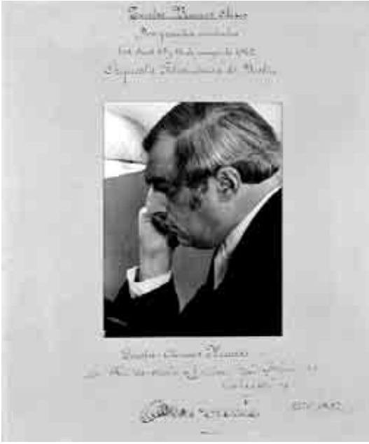
Clemens Krauss (1942)