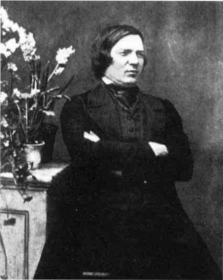
Robert Schumann hacia 1850