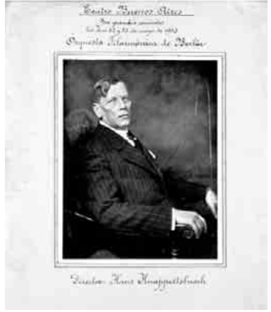
Hans Knappertsbusch (1943)