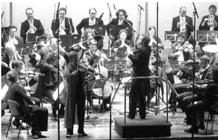
Grabación del concierto para violín de Brahms.