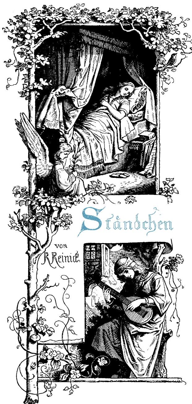
Adrian Ludwing Richter (1803-1884): Serenata